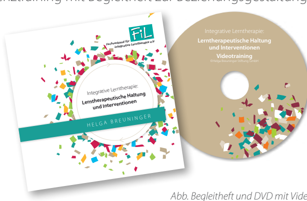
Abb. Begleitheft und DVD mit Videotraining